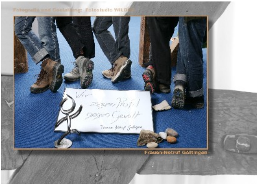
Frauen-Notruf e.V. Göttingen „Wir zeigen Profil gegen Gewalt“